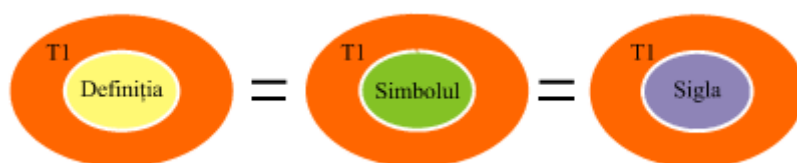
Graful 2. Raporturile sinonimice între termen și diferite forme de exprimare ale lui.

Astfel, în terminologia dreptului comunitar se stabilesc raporturi sinonimice: