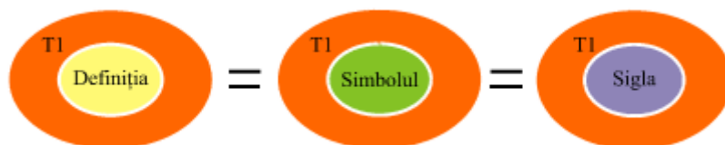
Graful 2. Raporturile sinonimice între termen și diferite forme de exprimare ale lui.

Astfel, în terminologia dreptului comunitar se stabilesc raporturi sinonimice: