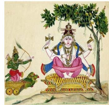
Kamadeva lovindu-l cu săgeata pe zeul Shiva

despre îngerii buddhiști și hinduși, despre îngerii islamici, despre îngerii celtici. Exotismul acestor