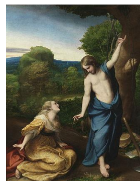
Noli me tangere de Antonio Allegri da Correggio, zis Le Corregge, 1525

construiesc pe baza categorizărilor sociale, larg acceptate. Prejudecățile sunt atitudini sau răspunsuri afective formulate fără analiza corectă sau în profunzime a obiectului ori fără a avea suficientă informație despre acesta. Se bazează pe judecăți stereotipe, pe generalizări incorecte sau pripite și de obicei au încărcătură negativă și sunt amprentate emoțional. În Scrisoarea IV aparența angelică a unei pământene indică prezența stereotipului femeii înger atât de persiflat și de către unii dintre contemporanii lui Eminescu (vezi formularea caragialiană „Angel radios!”). Descrierea femeii angelice este umbrită de congresul de rubedenii, de superficialitatea și frivolitatea femeii, care nu are atributele convenite de stereotip. În acest caz, stereotipul devalorizează imaginea prin contrast, iar autorul parodiază celebrul tablou al lui Correggio Noli me tangere ( Nu mă atinge, Nu mă mai reține, Nu te mai agăța de mine, Încetează să ... ), celebrele cuvinte ale lui Iisus adresate Mariei din Magdala în dimineața Învierii pascale ( Ioan 20: 17):