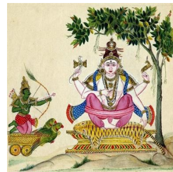
Kamadeva lovindu-l cu săgeata pe zeul Shiva

despre îngerii buddhiști și hinduși, despre îngerii islamici, despre îngerii celtici. Exotismul acestor