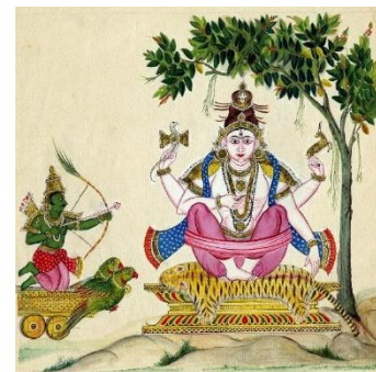
Kamadeva lovindu-l cu săgeata pe zeul Shiva

despre îngerii buddhiști și hinduși, despre îngerii islamici, despre îngerii celtici. Exotismul acestor