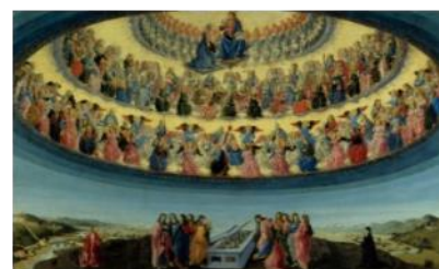
Adormirea Maicii Domnului de Francesco Botticini, National Gallery London, ilustrează cele trei ierarhii și nouă ordine de îngeri