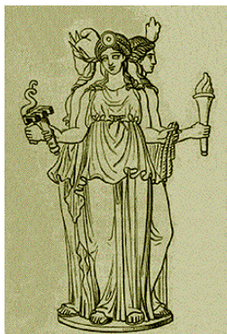
Hecate, zeița greacă de la răspântiile drumurilor, desen de Stéphane Mallarmé în Les Dieux Antiques, nouvelle mythologie illustrée , Paris, 1880

Experiența pe pământ a îngerilor poate fi și una a maturizării și a iubirii înțelepte, a compasiunii și a iertării. Așa ar putea fi înțelese cuvintele Luceafărului. Prin transfigurarea suferinței rezultată din faptul că el a confundat frumusețea pământeană cu una angelică (fata de împărat era „precum fecioara între sfinți”), Luceafărul și-a învățat lecția predată de Demiurg. Numele Cătălina / Cătălin înrudit cu cel de Ecaterina vine de la „aikaterine” αικατερίνη, nume grecesc ce este derivat din cuvântul grec „katharos” καθαρός și înseamnă „pur”.