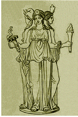
Hecate, zeița greacă de la răspântiile drumurilor, desen de Stéphane Mallarmé în Les Dieux Antiques, nouvelle mythologie illustrée , Paris, 1880

Experiența pe pământ a îngerilor poate fi și una a maturizării și a iubirii înțelepte, a compasiunii și a iertării. Așa ar putea fi înțelese cuvintele Luceafărului. Prin transfigurarea suferinței rezultată din faptul că el a confundat frumusețea pământeană cu una angelică (fata de împărat era „precum fecioara între sfinți”), Luceafărul și-a învățat lecția predată de Demiurg. Numele Cătălina / Cătălin înrudit cu cel de Ecaterina vine de la „aikaterine” αικατερίνη, nume grecesc ce este derivat din cuvântul grec „katharos” καθαρός și înseamnă „pur”.