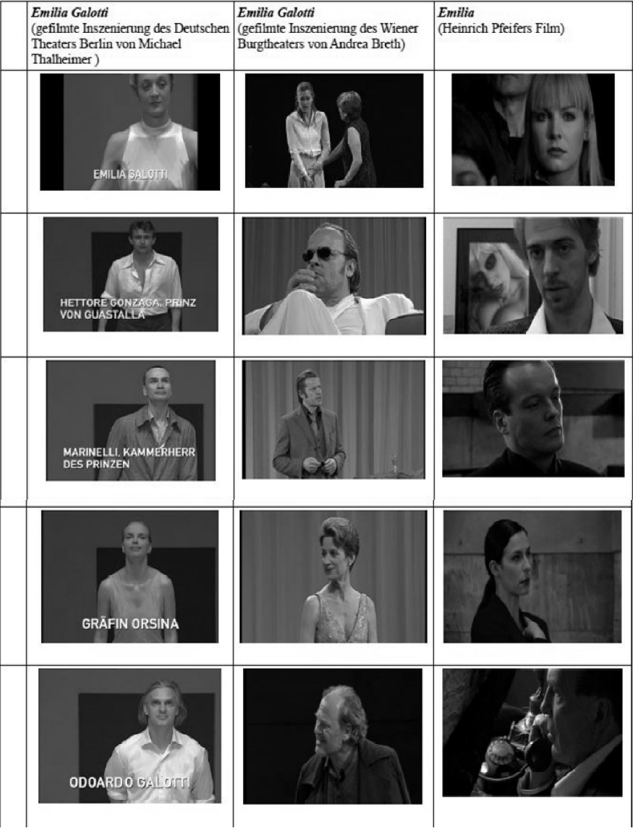
Abb. 3: Vorstellung der Figuren bzw. Schauspieler