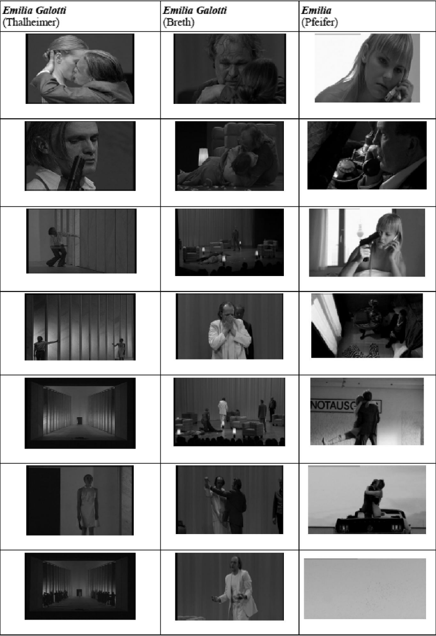
Abb. 4: Vergleich der Schlussequenzen mit eigenen Filmstills