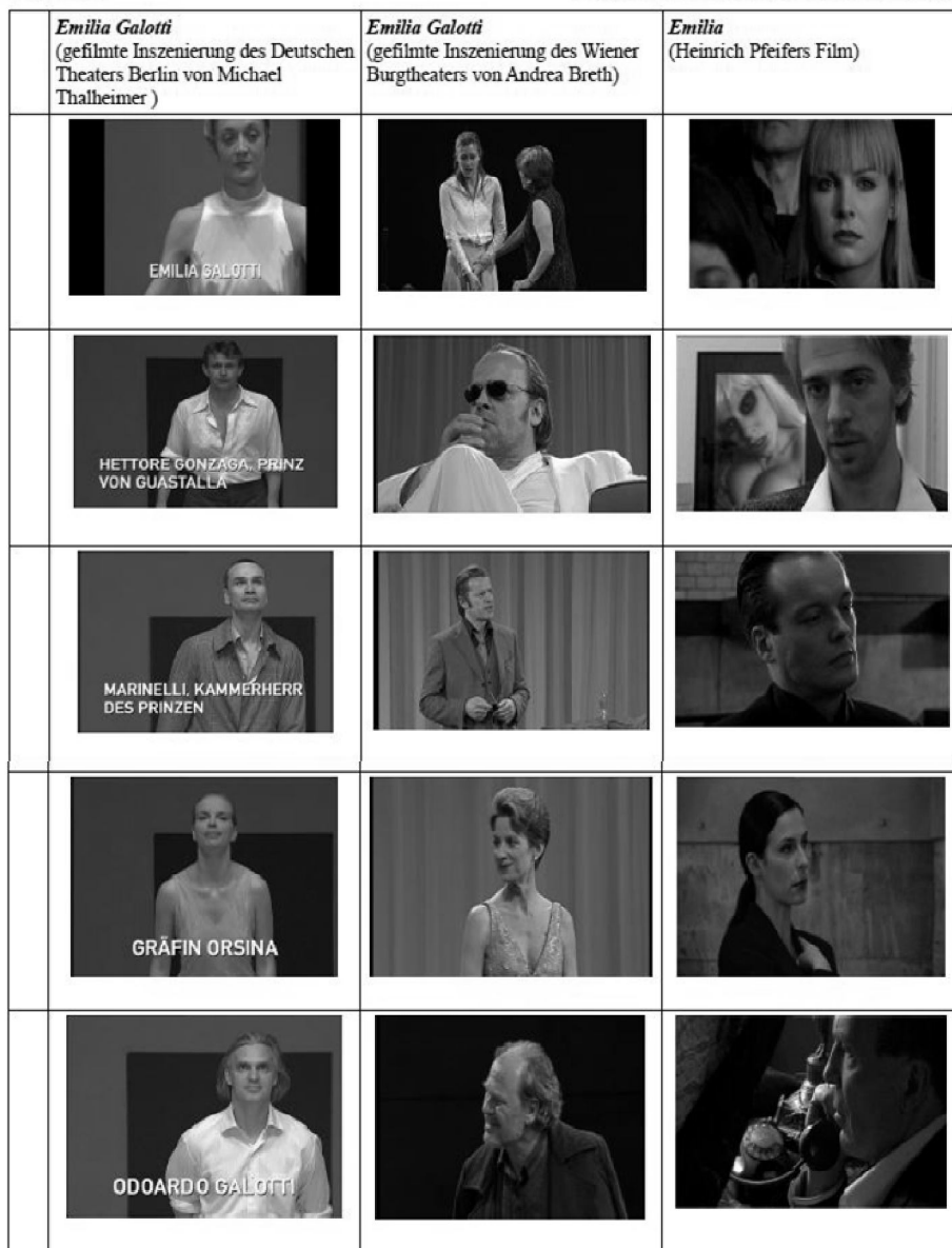
Abb. 3: Vorstellung der Figuren bzw. Schauspieler