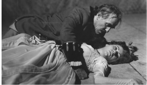
Abb. 1: Filmstill aus der DEFA-Produktion von 1958

So interessant diese Filme aus historischer Sicht sind, die Herzen von heutigen Schülern lassen sich damit nicht oder nur schwer gewinnen. Allerdings könnten sich diese für die Aktenbefunde zum Drehbuch aus der Zeit der DDR interessieren und sich so evtl. schon etwas für die Schlusszene sensibilisieren lassen, die wir uns in den aktualisierten Filmen ansehen wollen: Das Drehbuch von Hellberg wurde in der DDR als zu religiös kritisiert und zensiert und erst freigegeben, als die religiösen Szenen und Motive aus dem Drehbuch entfernt waren, was offenbar ein normaler Vorgang in den 1950er Jahren der DDR war.