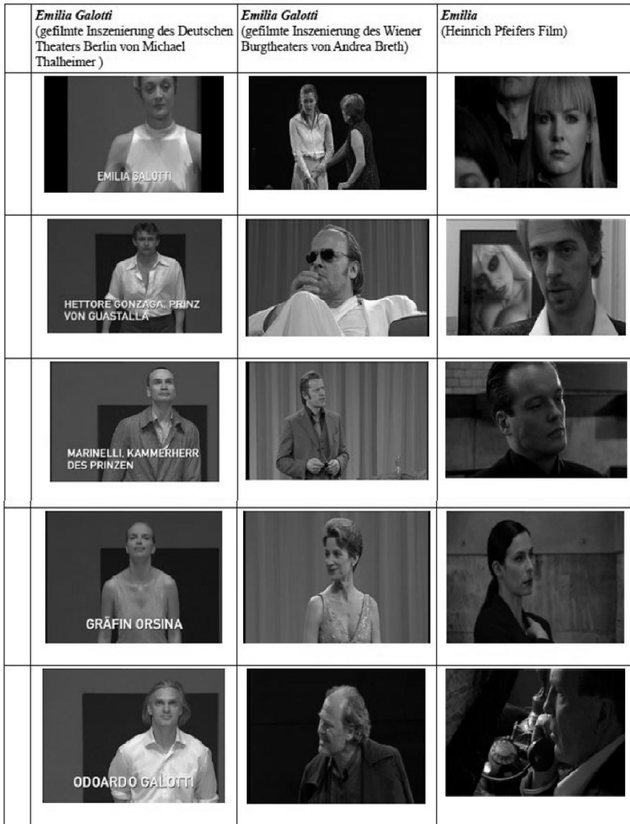
Abb. 3: Vorstellung der Figuren bzw. Schauspieler