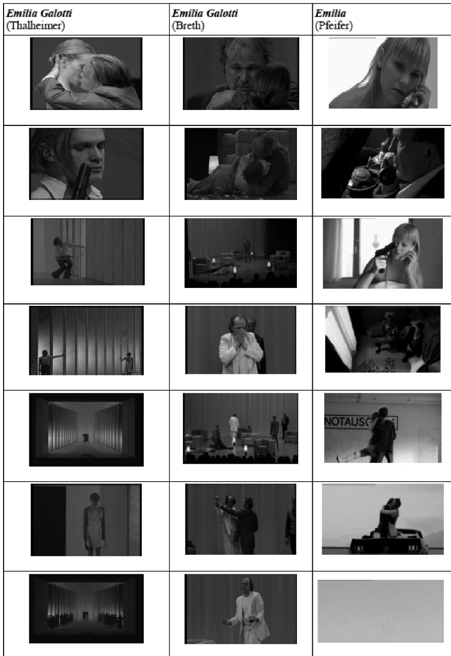
Abb. 4: Vergleich der Schlussesequenzen mit eigenen Filmstills