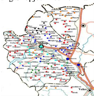
Abb. 1: Der Kreis von Skopje 3

Die Region von Skopje bildet auf der Podvardarska einen eigenen Talkessel, der auf allen Seiten durch hohe Berge von den umliegenden Regionen isoliert wird: Kitka im Südosten, Žeden und Voden im Süden und Karadak im Westen und Norden. Durch die Schlucht Derven im Westen und durch das Tal des Flusses Lepenca im Norden bestehen wenige geographische Verbindungen zu Tetovo und Kačanik. Außer der schon beschriebenen Stadt gehören noch Derven i Poshtëm im nordwestlichen Vardar-Tal, die Berggegend des Karadak (maz. Skopska Crna Gora, alb. Mali i Zi i Shkupit) im Norden sowie die Berggegend von Karshiaka im Süden entlang an den Bergen Žeden und Voden als eigenständige geographische Einheiten zum Kreis von Skopje, da für sie der Markt in Skopje zugänglich war und auch heute administrativ zu Skopje gehören. Die Gemeinde Haračinë wird seit einem Jahrzehnt durch die Ausdehnung Skopjes in seinen Bann gezogen.