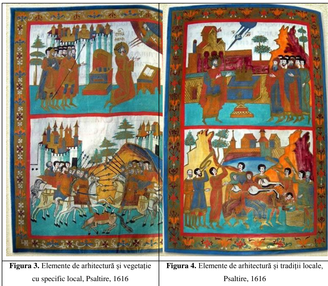
Figura 3. Elemente de arhitectură și vegetație cu specific local, Psaltire, 1616