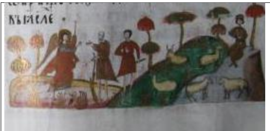
Figura 2. Detaliu Manuscris Sucevița 24

Elementele cu specific național întâlnite în Tetraevangheliarul Sucevița 24 sunt: brazii, cetățile cu turnuri și creneluri moldovenești amintind de incintele fortificate ale mănăstirilor moldovenești, precum și aspecte cu caracter local ale vieții cotidiene, care făceau parte integrantă din orizontul pictorului respectiv; ciobanul cântând din fluier alături de oile sale, lucrătorii viei cu unelte specifice acestei activități (sapă, hârleț, etc.) 6 (Figura 2).