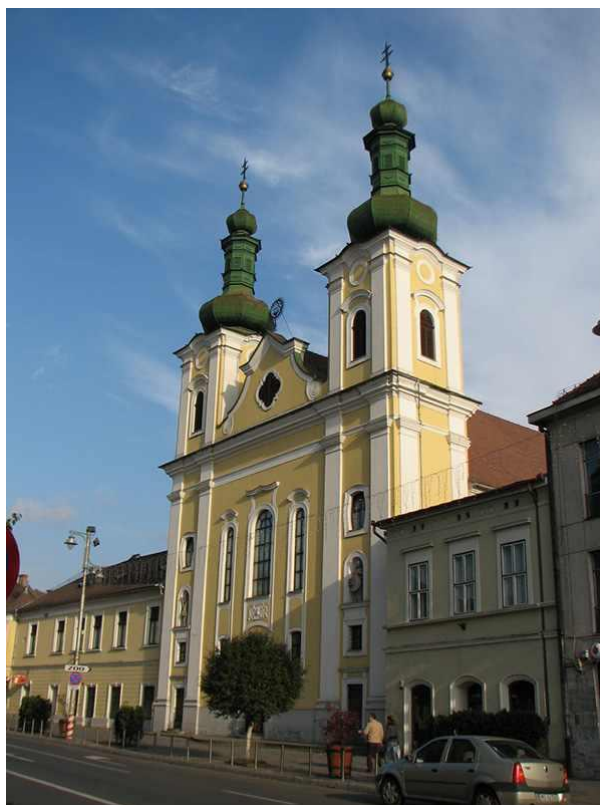
Fig. 1. Biserica Sfântul Ioan Botezătorul