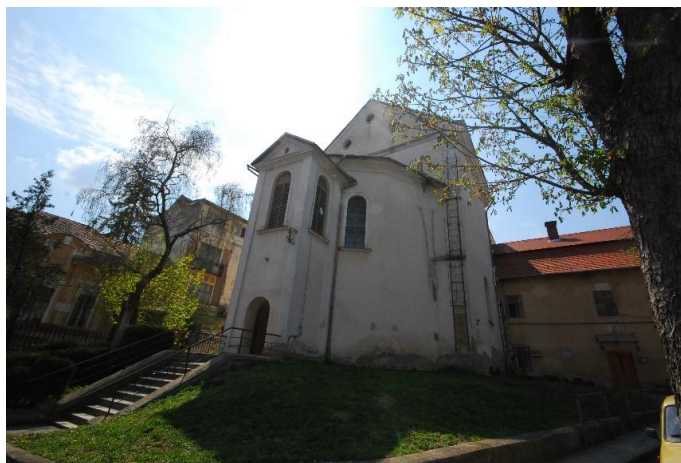
Fig. 3. Biserica minorită cu hramul Sfântul Anton de Padova

după cea din Cluj-Napoca. Preferința aceasta se va putea vedea la Biserica Franciscană din Budapesta construită la începutul anilor 1800. Putem observa în exemplele acestea urmărirea unui model deja consacrat de arhitectură ecleziastică.