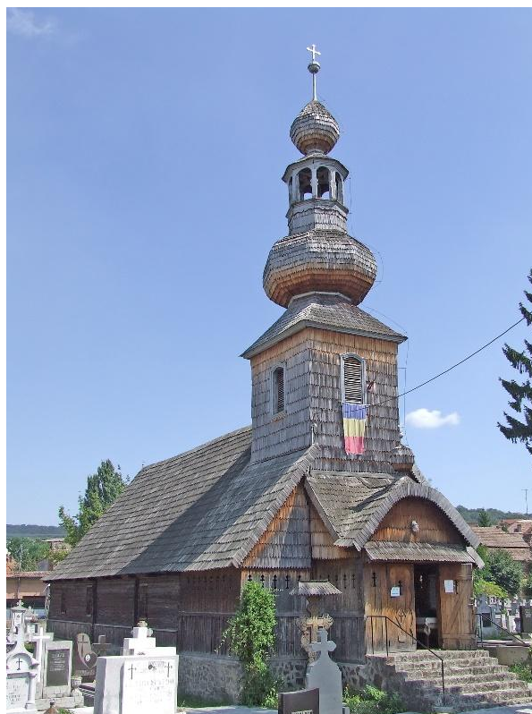
Fig. 4. Biserica ortodoxă cu hramul Sfântul Arhanghel Mihail