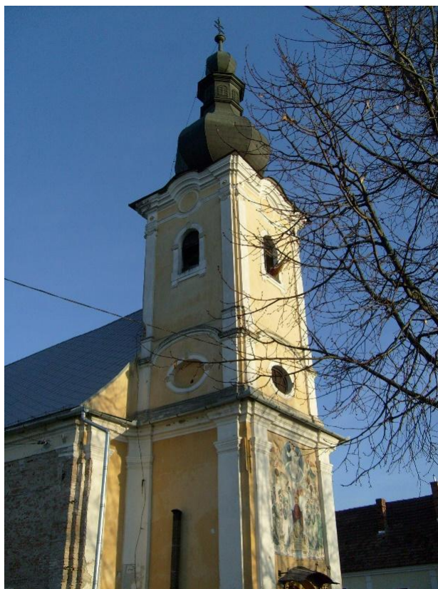
Fig. 5. Biserica de Piatră cu hramul Învierea Domnului

În același an a fost ridicată și Biserica de Piatră cu hramul Învierea Domnului (fig. 5), în vecinătatea bisericii de mai sus. Înaintea acestei biserici ctitorite de episcopul unit Ioan Bob, a existat o capelă mică de rit ortodox ridicată de comerciantul Andrei Grecul în anii 1750, dar care la moartea sa a fost dată greco-catolicilor 13 . Arhitectul bisericii este Johannes Topler, găsit și plătit de episcopul Ioan Bob, cel care s-a îngrijit ca românii din Tîrgu Mureș să aibă o biserică a lor 14 . Planimetria este simplă, avem o zonă de acces care se face printr-un turn cu plan pătrat, în continuarea căreia se găsește naosul și altarul semicircular, peste care sunt realizate perechi de calote boeme.