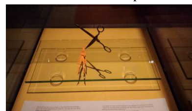
Magia decupării personajelor Muzeul H. Chr. Andersen Hus, Odense