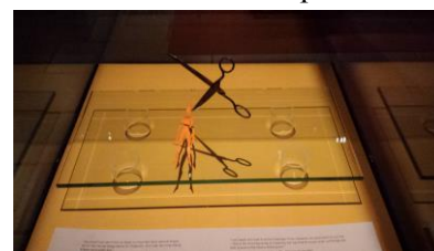
Magia decupării personajelor Muzeul H. Chr. Andersen Hus, Odense