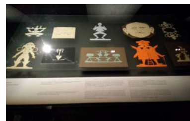
Magia decupării personajelor, Muzeul H. Chr. Andersen Hus, Odense

Alteori, aceste elemente autobiografice constituie pentru posteritate o mărturie asupra epocii și mai ales asupra evenimentelor la care autorul a participat direct. Hans Christian Andersen a călătorit și a cunoscut direct o mulțime de spirite luminate ale epocii sale din întreaga Europă. Alteori, elementele autobiografice proiectate în narațiune au rolul de a îndrepta faptele, de a dezminți judecățile nepotrivite, de a-l justifica pe autor în fața celui care citește. Eul poetic este o mărturie a încercării de realizare a opoziției între poet, ca individ martor al faptelor zugrăvite, și lumea contemporană, marcată de superficialitate, înverșunată invidie și de degradare. Antiteza romantică între trecutul glorios și prezentul decăzut ia naștere din atitudinea paseistă a poetului, care găsește în imaginarul timp revolut un refugiu privilegiat de unde poate comenta, compara, sintetiza și concluziona în privința direcției și înțelesurilor lumii contemporane.