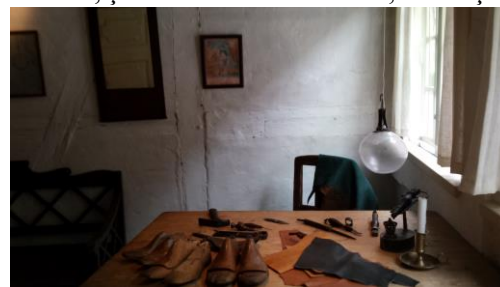
Camera cu unelte de lucru ale tatălui lui Hans Christian Andersen, Muzeul H. Chr. Andersen Hus, Odense

În Povestea vieții mele , Hans Christian Andersen își amintește cu emoție anii copilăriei: „În 1805 trăia la Odense, într-o modestă cămăruță, o pereche de tineri căsătoriți, care se iubeau tare mult. El, în vârstă de vreo 22 de ani, cizmar, era un om înzestrat și avea o fire de poet. Ea, cu câțiva ani mai mare, femeie simplă și necunosătoare în ale vieții, avea o inimă minunată. Ajuns de curând lucrător,