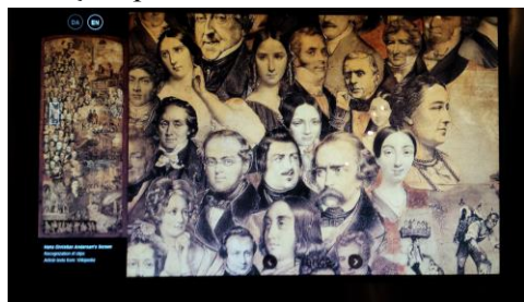
Andersen și contemporanii săi întâlniți în timpul călătoriilor prin Europa Muzeul H. Chr. Andersen Hus, Odense

În opera lui Ion Creangă, elementele autobiografice folosite pentru crearea mărcii monografice constituie un prilej de a demonstra credibilitatea mărturiei adresate publicului. Autorul Amintirilor din copilărie fusese, până în momentul publicării acestei lucrări, cunoscut drept scriitorul Poveștilor , al Povestirilor și al Abecedarului . Amintirile din copilărie oferă indicii referitoare la momentele-cheie ale evoluției spirituale a scriitorului. Caracterul de Bildungsroman al operei exprimă și el această idee.