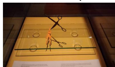
Magia decupării personajelor Muzeul H. Chr. Andersen Hus, Odense