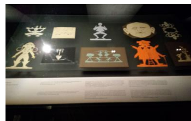
Magia decupării personajelor, Muzeul H. Chr. Andersen Hus, Odense

Alteori, aceste elemente autobiografice constituie pentru posteritate o mărturie asupra epocii și mai ales asupra evenimentelor la care autorul a participat direct. Hans Christian Andersen a călătorit și a cunoscut direct o mulțime de spirite luminate ale epocii sale din întreaga Europă. Alteori, elementele autobiografice proiectate în narațiune au rolul de a îndrepta faptele, de a dezminți judecățile nepotrivate, de a-l justifica pe autor în fața celui care citește. Eul poetic este o mărturie a încercării de realizare a opoziției între poet, ca individ martor al faptelor zugrăvite, și lumea contemporană, marcată de superficialitate, înverșunată invidie și de degradare. Antiteza romantică între trecutul glorios și prezentul decăzut ia naștere din atitudinea paseistă a poetului, care găsește în imaginarul timp revolut un refugiu privilegiat de unde poate comenta, compara, sintetiza și concluziona în privința direcției și înțelesurilor lumii contemporane.