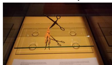
Magia decupării personajelor Muzeul H. Chr. Andersen Hus, Odense