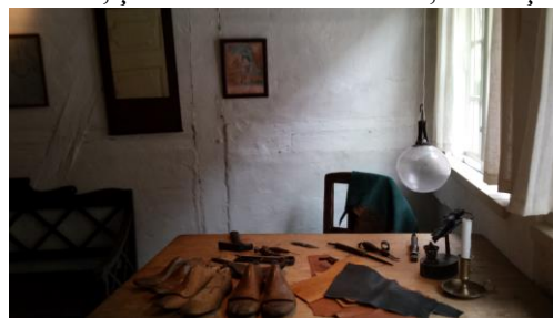
Camera cu unelte de lucru ale tatălui lui Hans Christian Andersen, Muzeul H. Chr. Andersen Hus, Odense

În Povestea vieții mele , Hans Christian Andersen își amintește cu emoție anii copilăriei: „În 1805 trăia la Odense, într-o modestă cămăruță, o pereche de tineri căsătoriți, care se iubeau tare mult. El, în vârstă de vreo 22 de ani, cizmar, era un om înzestrat și avea o fire de poet. Ea, cu câțiva ani mai mare, femeie simplă și necunosătoare în ale vieții, avea o inimă minunată. Ajuns de curând lucrător,