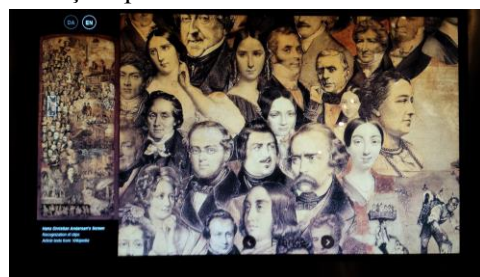
Andersen și contemporanii săi întâlniți în timpul călătoriilor prin Europa Muzeul H. Chr. Andersen Hus, Odense

În opera lui Ion Creangă, elementele autobiografice folosite pentru crearea mărcii monografice constituie un prilej de a demonstra credibilitatea mărturiei adresate publicului. Autorul Amintirilor din copilărie fusese, până în momentul publicării acestei lucrări, cunoscut drept scriitorul Poveștilor , al Povestirilor și al Abecedarului . Amintirile din copilărie oferă indicii referitoare la momentele-cheie ale evoluției spirituale a scriitorului. Caracterul de Bildungsroman al operei exprimă și el această idee.