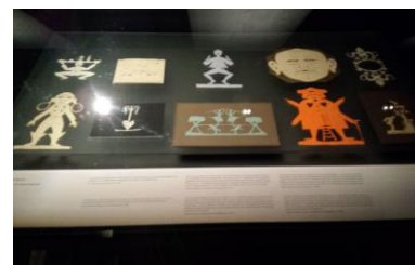
Magia decupării personajelor, Muzeul H. Chr. Andersen Hus, Odense

Alteori, aceste elemente autobiografice constituie pentru posteritate o mărturie asupra epocii și mai ales asupra evenimentelor la care autorul a participat direct. Hans Christian Andersen a călătorit și a cunoscut direct o mulțime de spirite luminate ale epocii sale din întreaga Europă. Alteori, elementele autobiografice proiectate în narațiune au rolul de a îndrepta faptele, de a dezminți judecățile nepotrivite, de a-l justifica pe autor în fața celui care citește. Eul poetic este o mărturie a încercării de realizare a opoziției între poet, ca individ martor al faptelor zugrăvite, și lumea contemporană, marcată de superficialitate, înverșunată invidie și de degradare. Antiteza romantică între trecutul glorios și prezentul decăzut ia naștere din atitudinea paseistă a poetului, care găsește în imaginarul timp revolut un refugiu privilegiat de unde poate comenta, compara, sintetiza și concluziona în privința direcției și înțelesurilor lumii contemporane.