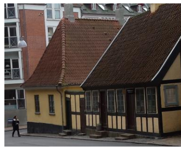
Casa lui Hans Christian Andersen, Odense

Hans Christian Andersen își amintea că fusese învățat să citească de către o bătrână învățătoare care „Se așeza într-un fotoliu, cu spătar înalt aproape de orologiu. Când bătea orele, ceasul declanșa un mecanism ciudat, făcând să defileze prin fața noastră o serie de personaje mici, grozav de amuzante. Învățătoarea avea la îndemână o nuiă cu care croia în