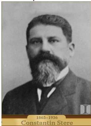
1865-1936 Constantin Stere