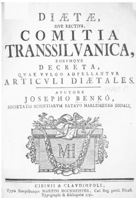
Joseph Benkő, Dietae sive rectius comitia Transsilvanica , Cluj-Sibiu, 1791.