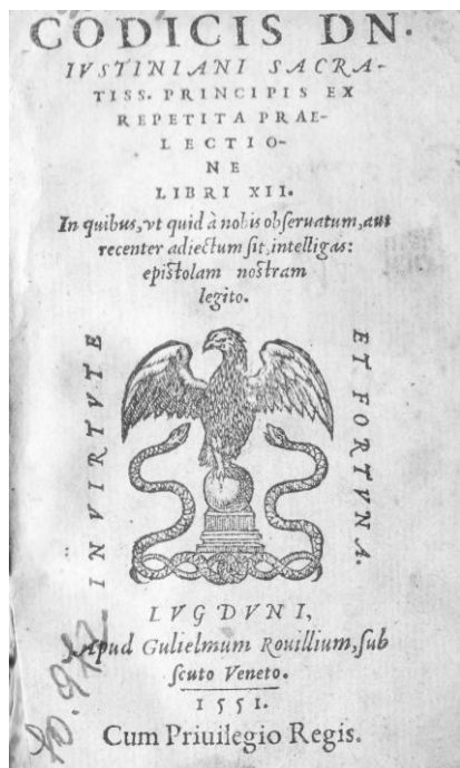
Codex Iustinianus, Lyon, 1551.