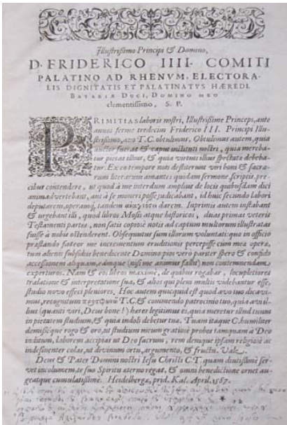
Ex libris Nicolae Mavrocordat