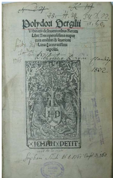
Figura 7 - 1505