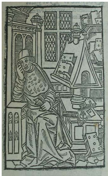
Figura 8 - Atelier de legătorie 1505, 10 ian.