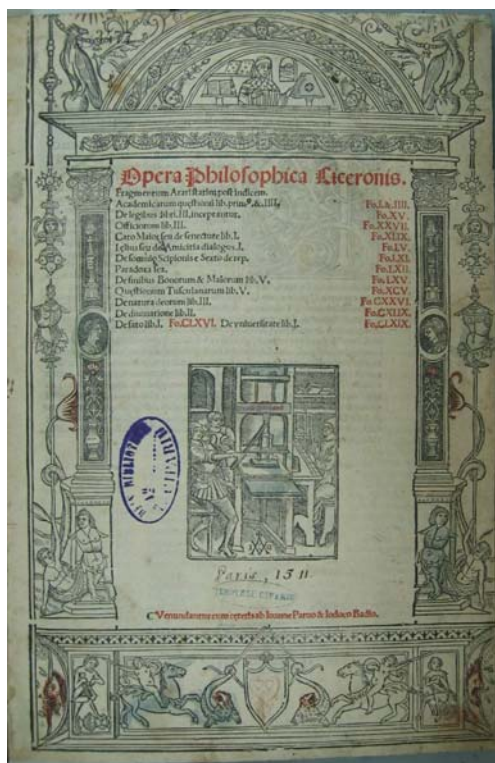
Figura 1 - 1511