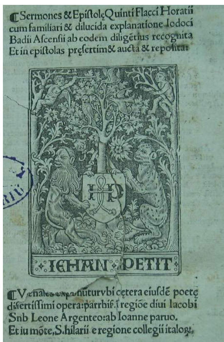
Figura 2a - 1503