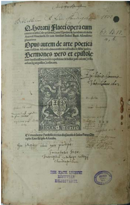
Figura 3 - 1511