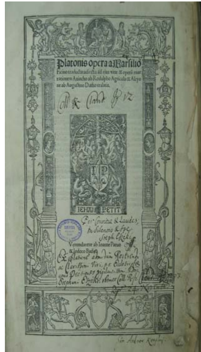
Figura 4 - 1518