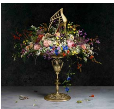
Promotion Chr. Louboutin