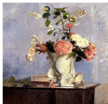
Camille Pissarro, "Bouquet de Fleurs"