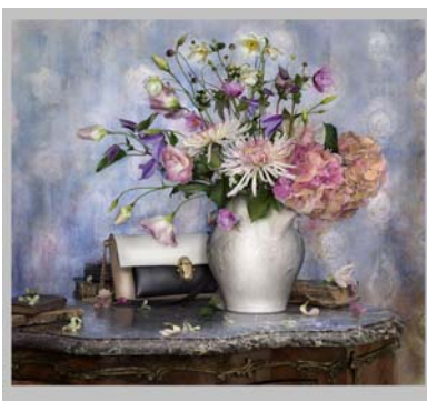
Promotion Chr. Louboutin