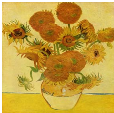
Vincent van Gogh, “Tournesols”