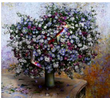
Promotion Chr. Louboutin