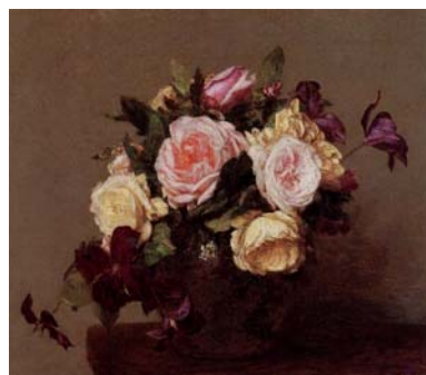
Henri Fantin-Latour, "Clematis and Roses"