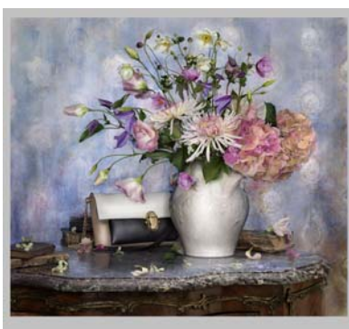
Promotion Chr. Louboutin