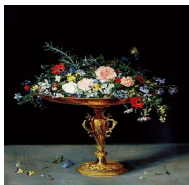
Jan Brueghel le Père, “Tazza con fiori”