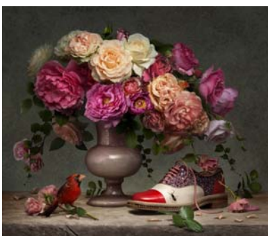
Promotion Chr. Louboutin