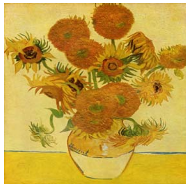
Vincent van Gogh, "Tournesols"