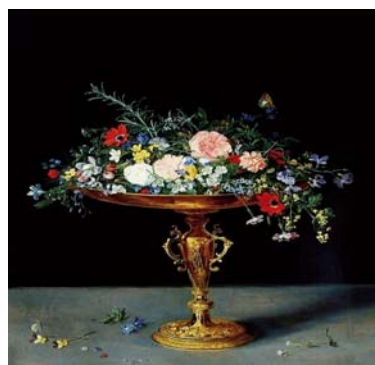
Jan Brueghel le Père, “Tazza con fiori”