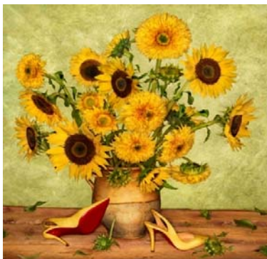
Promotion Chr. Louboutin