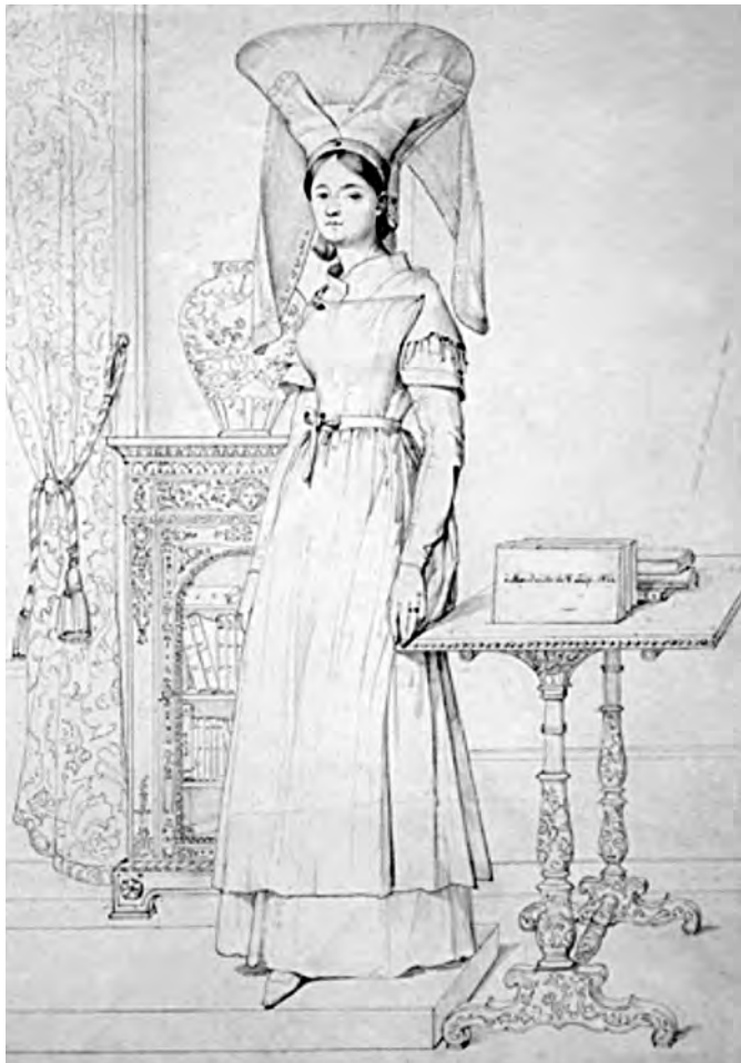
INGRES Femeie în costum specific regiunii Caen